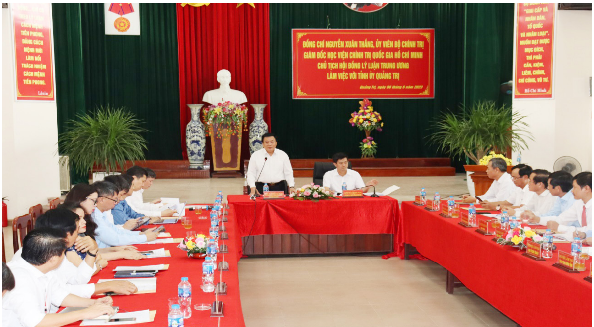
Đồng chí Nguyễn Xuân Thắng - Ủy viên Bộ Chính trị, Giám đốc Học viện Chính trị quốc gia Hồ Chí Minh, Chủ tịch Hội đồng lý luận Trung ương phát biểu tại buổi làm việc với Tỉnh ủy Quảng Trị tại Trường Chính trị Lê Duẩn (năm 2023).