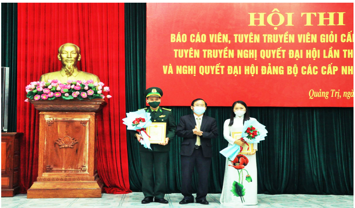
Trường Chính trị Lê Duẩn có 01 giảng viên đạt giải Nhì Hội thi báo cáo viên, tuyên truyền viên giỏi cấp tỉnh (năm 2021).