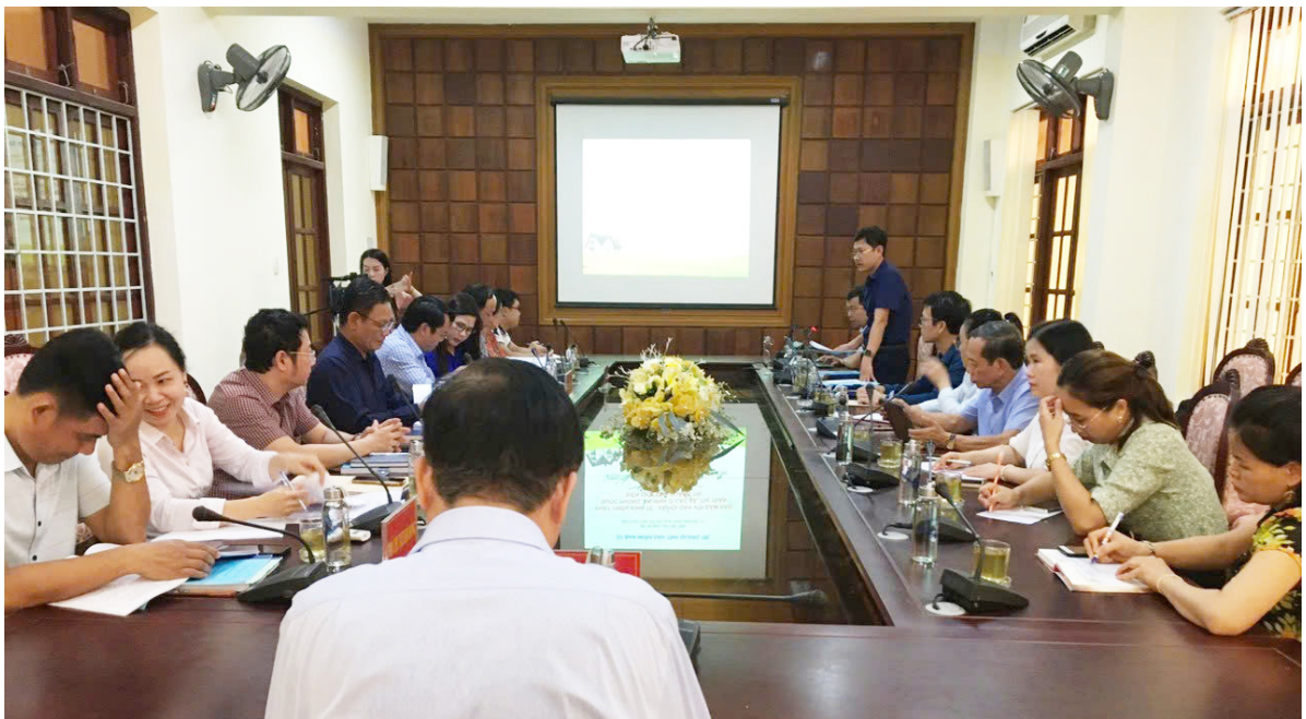
Nghiệm thu Đề tài cấp tỉnh tại Sở Khoa học và Công nghệ (năm 2024).