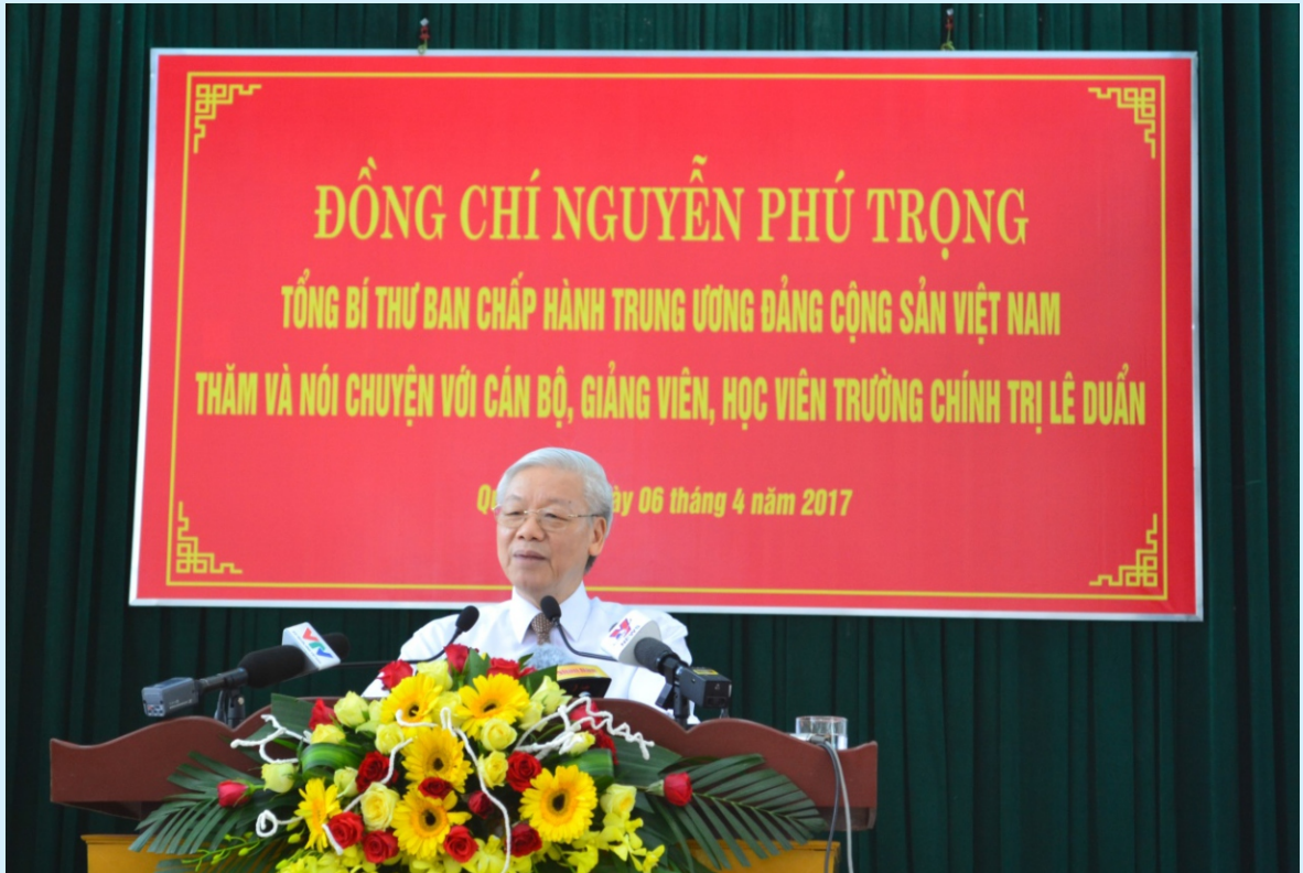
Tổng Bí thư Nguyễn Phú Trọng thăm và nói chuyện với cán bộ, giảng viên, học viên Trường Chính trị Lê Duẩn nhân kỷ niệm 110 năm Ngày sinh Tổng Bí thư Lê Duẩn (07/4/1907 - 07/4/2017).