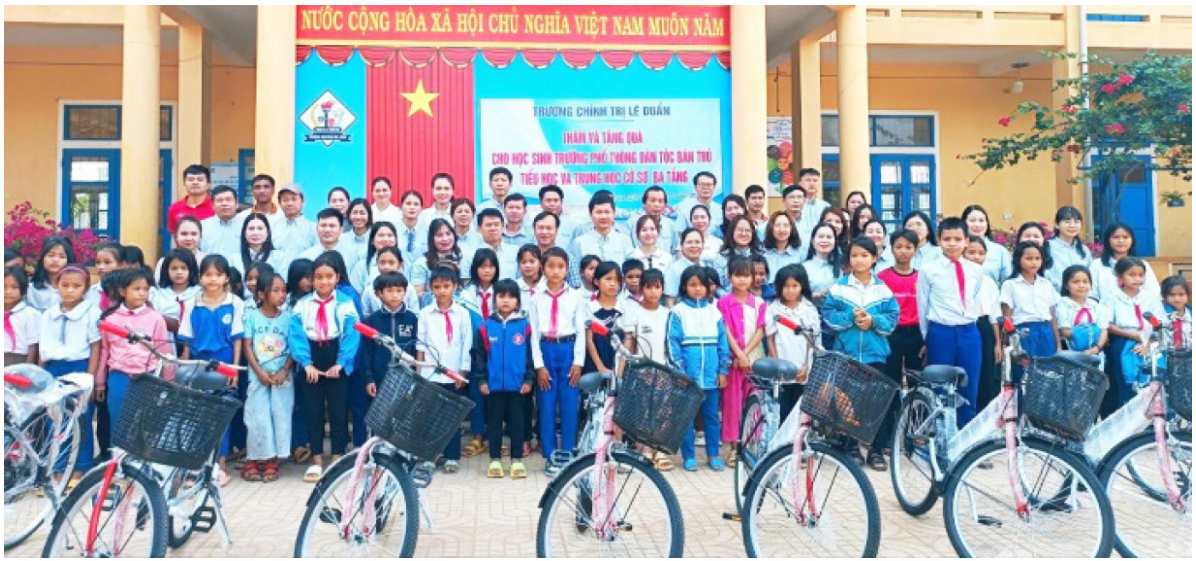
Công đoàn Trường Chính trị Lê Duẩn tổ chức chương trình thiện nguyện tại Trường Phổ thông Dân tộc bán trú - Tiểu học và Trung học cơ sở Ba Tầng, huyện Hướng Hóa năm 2024.