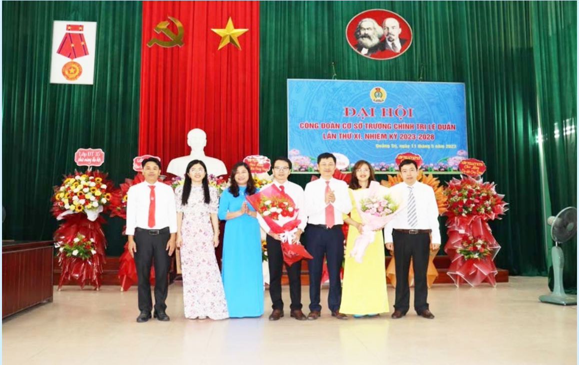
Đại hội Công đoàn cơ sở Trường Chính trị Lê Duẩn lần thứ XI, nhiệm kỳ 2023-2028.