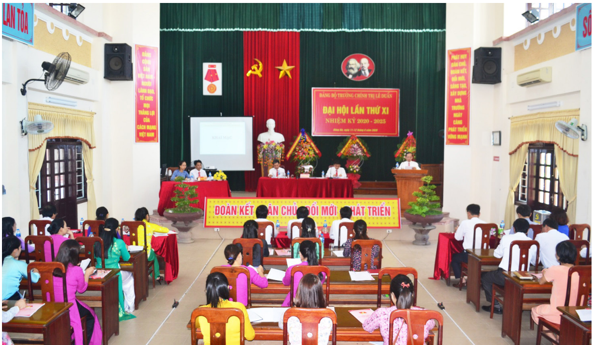
Đại hội Đảng bộ Trường Chính trị Lê Duẩn lần thứ XI, nhiệm kỳ 2020-2025.