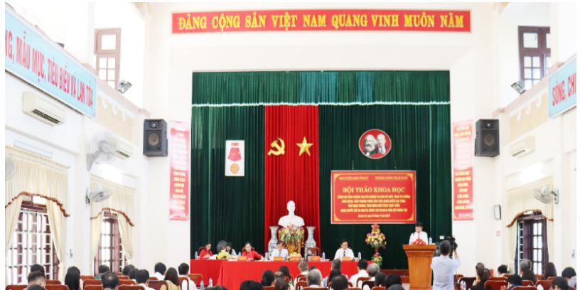
Hội thảo khoa học “Đảng bộ tỉnh Quảng Trị với nhiệm vụ bảo vệ nền tảng tư tưởng của Đảng, đấu tranh phản bác các quan điểm sai trái, thù địch trong tình hình mới (năm 2023).

Đối với Trường Chính trị Lê Duẩn - trung tâm đào tạo lý luận chính trị của tỉnh Quảng Trị -