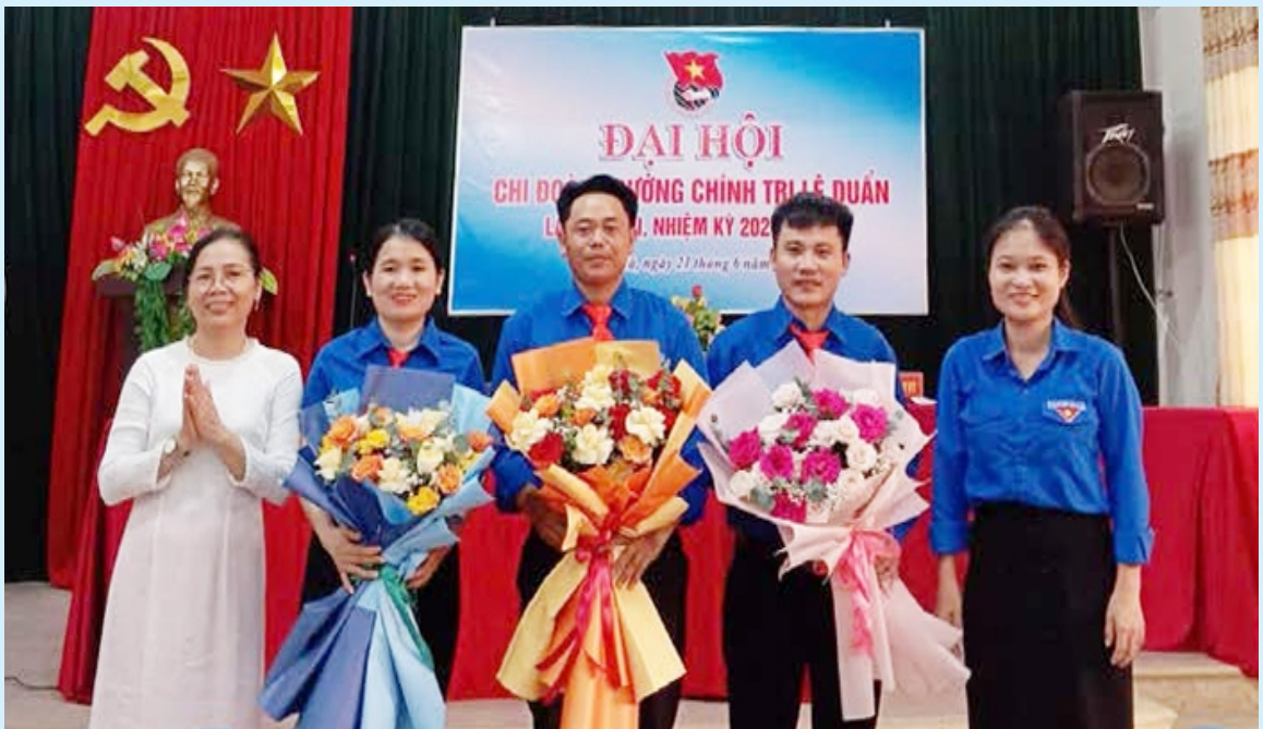
Đại hội Chi đoàn Trường Chính trị Lê Duẩn lần thứ 12, nhiệm kỳ 2024-2027.