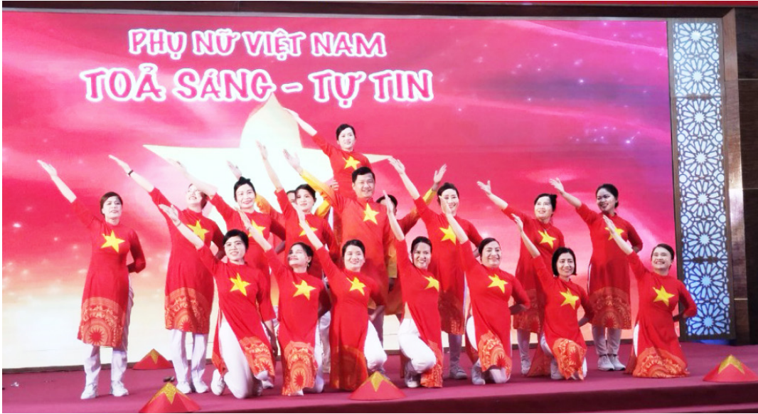
Tiết mục của Trường Chính trị Lê Duẩn đạt giải Nhì toàn Đoàn và Giải Ấn tượng nhất Liên hoan dân vũ do Công đoàn Viên chức tỉnh tổ chức.