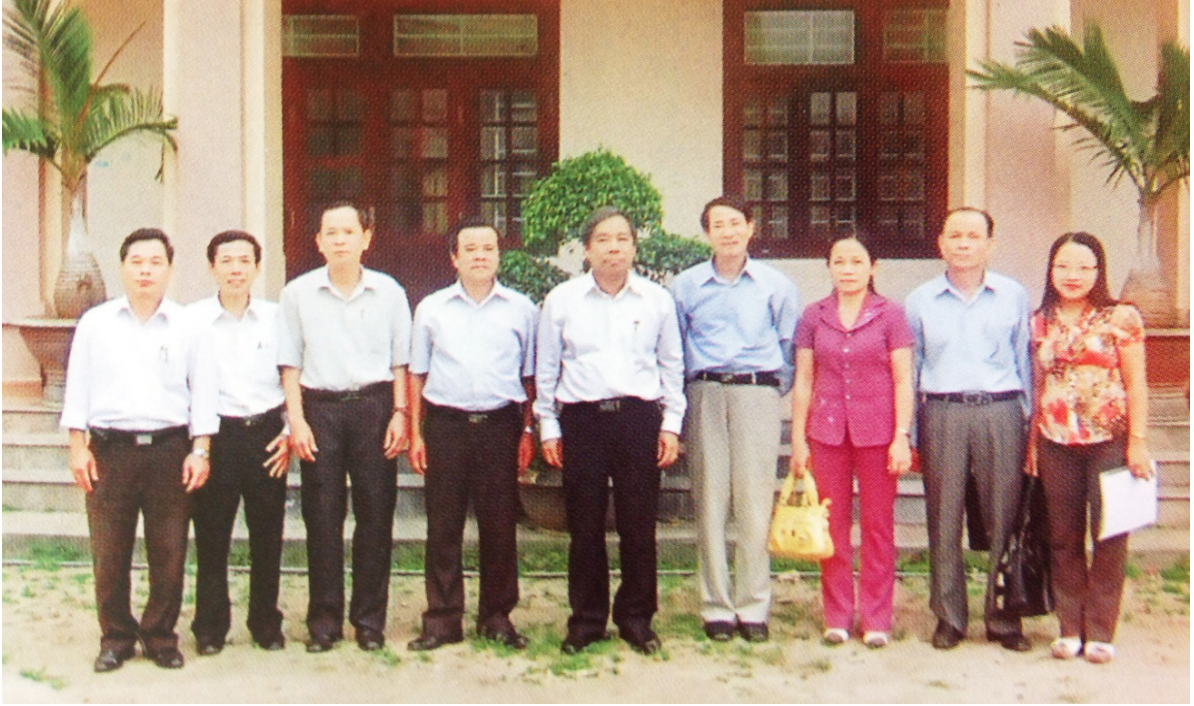
Đồng chí Lê Hữu Phúc - Ủy viên Ban Chấp hành Trung ương Đảng, Bí thư Tỉnh ủy, Chủ tịch HĐND tỉnh Quảng Trị đến thăm và làm việc tại Trường Chính trị Lê Duẩn (năm 2010).