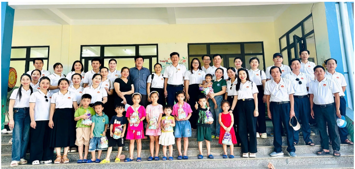
Công đoàn Trường Chính trị Lê Duẩn tổ chức chương trình thiện nguyện tại Trường Mầm non Phong Ba, huyện đảo Côn Cỏ (năm 2025).

Bám sát nhiệm vụ được giao của Nhà trường, kế hoạch phát động thi đua của Công đoàn cấp trên, Ban Chấp hành công đoàn luôn phối hợp chặt chẽ với Ban Giám hiệu, Đoàn Thanh niên, các khoa, phòng trong Nhà trường đã triển khai, phát động các phong trào thi đua yêu nước gắn với các hoạt động