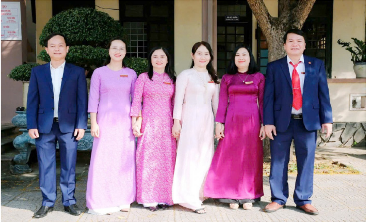
Cán bộ, giảng viên Phòng Quản lý đào tạo và nghiên cứu khoa học (năm 2025).

Trưởng Phòng Quản lý đào tạo và nghiên cứu khoa học