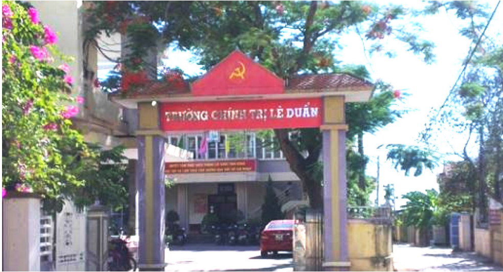
Trường Chính Trị Lê Duẩn

T rường Chính trị Lê Duẩn - ngôi trường mang tên Nhà lãnh đạo kiệt xuất của Đảng ta đã có bề dày lịch sử 80 năm xây dựng và phát triển. Trải qua bao thăng trầm, Trường không ngừng đổi mới, phát triển để đáp ứng yêu cầu đào tạo, bồi dưỡng cán bộ, góp phần quan trọng vào sự nghiệp phát triển của tỉnh nhà và đất nước. Là một cán bộ kế toán tuy thời gian công tác ở Nhà trường chưa lâu nhưng trong tôi luôn tự hào khi được cống hiến, được đồng hành cùng sự phát triển của nhà trường và chứng kiến những đổi thay đáng trân trọng.