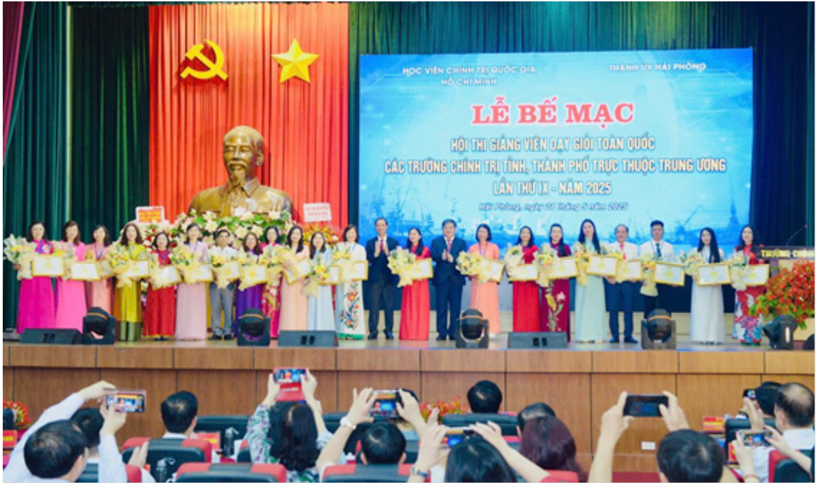
Trường Chính trị Lê Duẩn có 02 giảng viên đạt thành tích cao tại Hội thi Giảng viên dạy giỏi toàn quốc các trường chính trị tỉnh, thành phố trực thuộc Trung ương lần thứ IX (năm 2025).