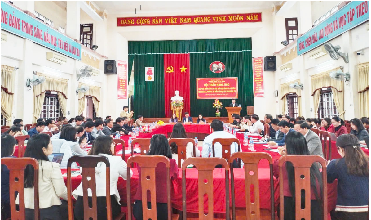
Hội thảo khoa học cấp cơ sở “Giải pháp nhằm nâng cao hiệu quả hoạt động của HĐND xã, phường, thị trấn trên địa bàn tỉnh Quảng Trị” (năm 2025).