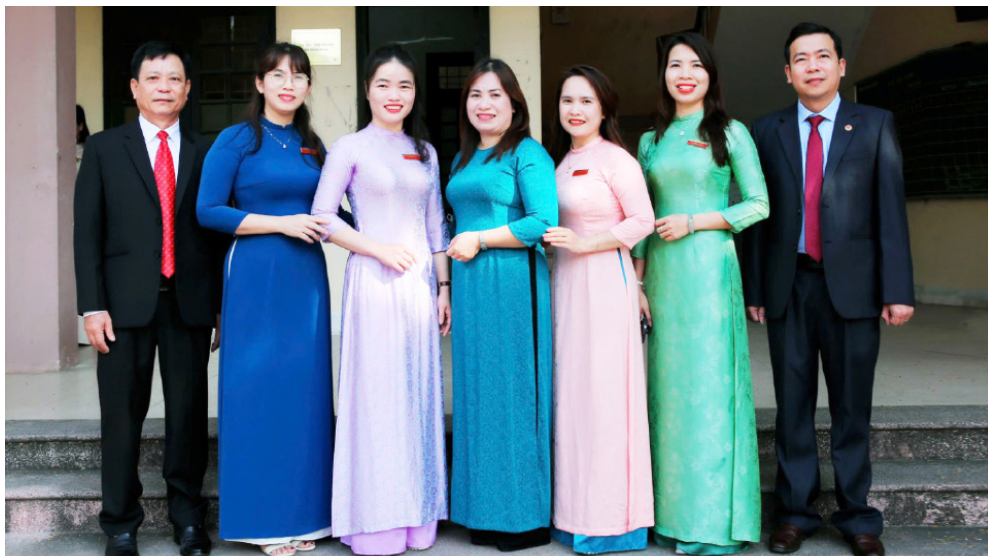
Giảng viên Khoa Lý luận cơ sở (năm 2025).