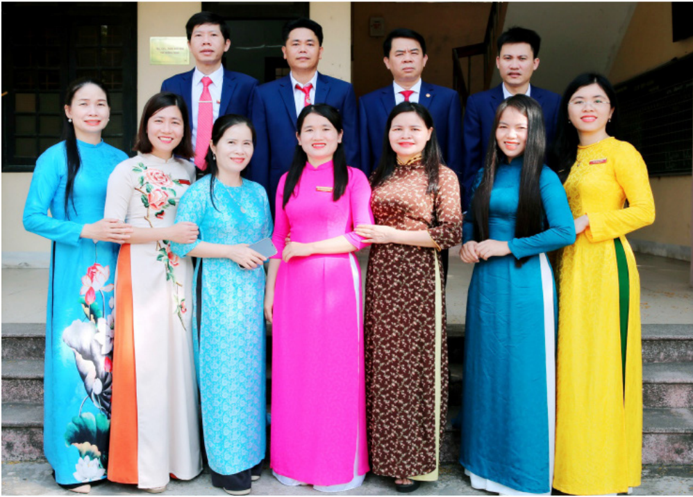
Giảng viên Khoa Xây dựng Đảng, Nhà nước và pháp luật (năm 2025).

Trưởng Khoa Xây dựng Đảng, Nhà nước và pháp luật