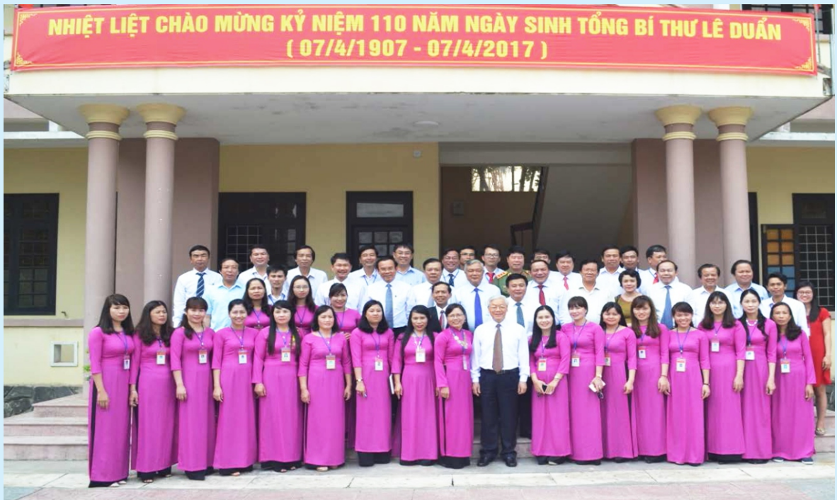
Tổng Bí thư Nguyễn Phú Trọng chụp ảnh lưu niệm với lãnh đạo tỉnh Quảng Trị và cán bộ, giảng viên Trường Chính trị Lê Duẩn (năm 2017).