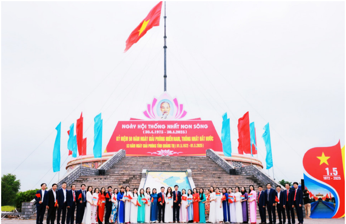
Tập thể Nhà trường chụp ảnh lưu niệm tại cột cờ Hiền Lương nhân kỷ niệm 50 năm Ngày Giải phóng miền Nam thống nhất đất nước (30/4/1975 - 30/4/2025)